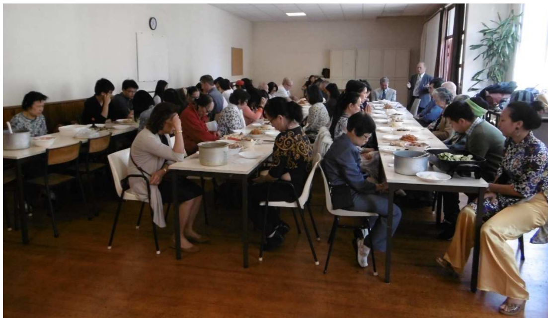
Prière avant le repas