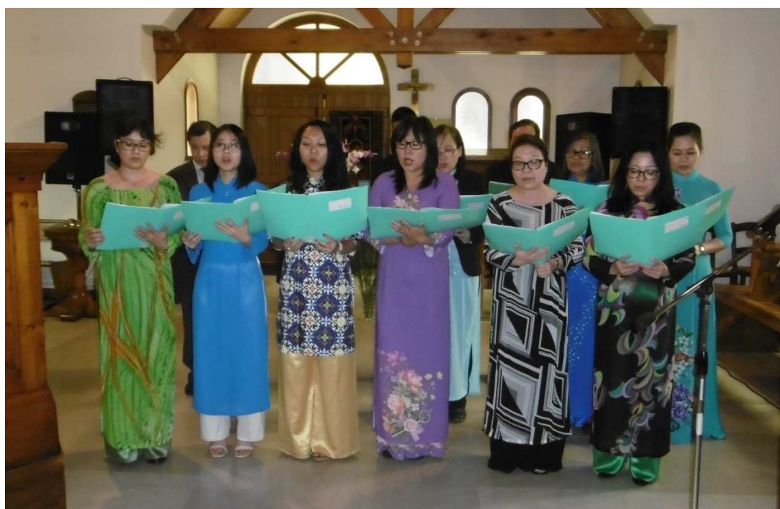
Chant: Hiến cả thân cho Ngài (Tout offrir à Dieu) – Chorale de Paris