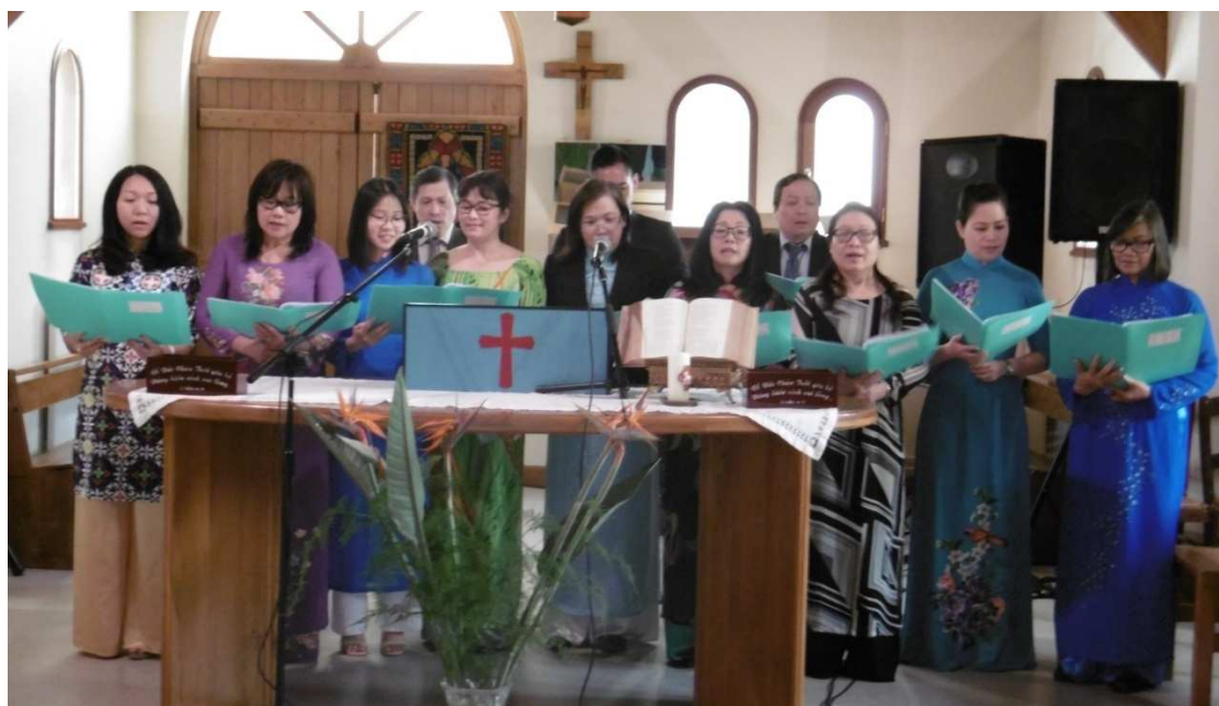
Chant: Bài ca cảm tạ (Chanson de remerciement) – Chorale de Paris