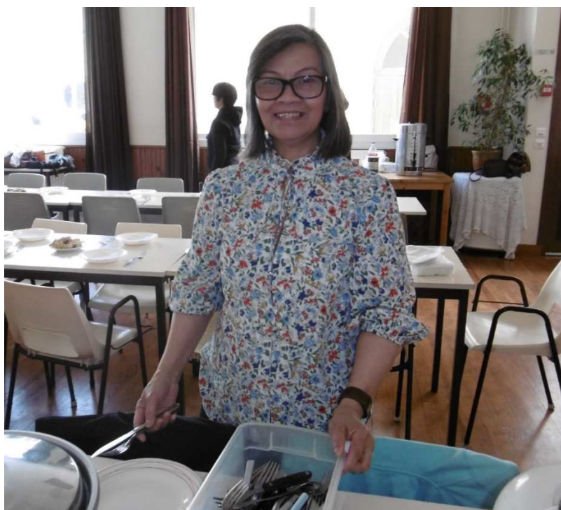
Le Comité des Femmes préparant les couverts