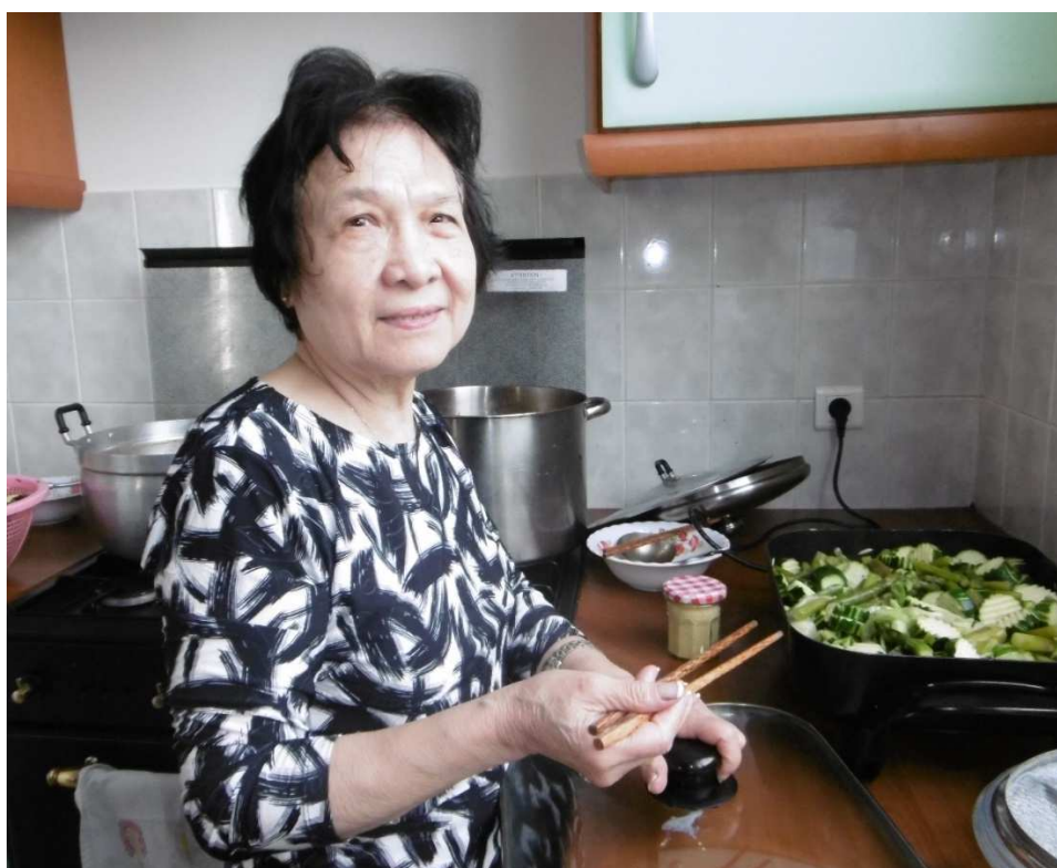
Le Comité des Femmes de Paris préparant les repas