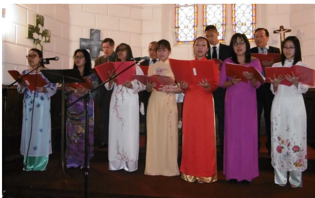
Chant: Nếu khi nào (Et si jamais...) – Chorale de Paris