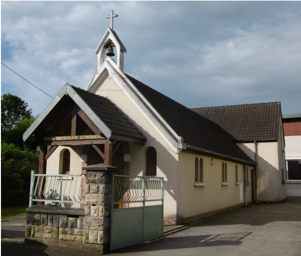
Lieu: Eglise Saint Matthieu à Pontault-Combault