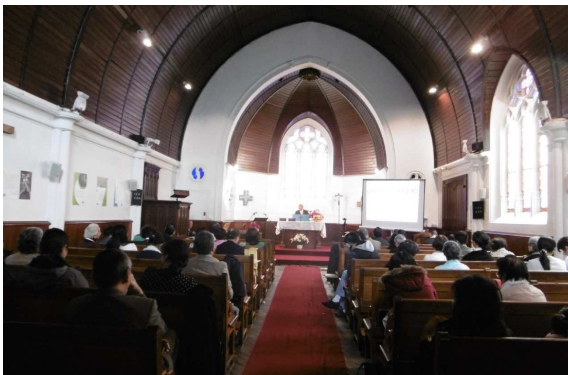
Ecoute de la parole de Dieu