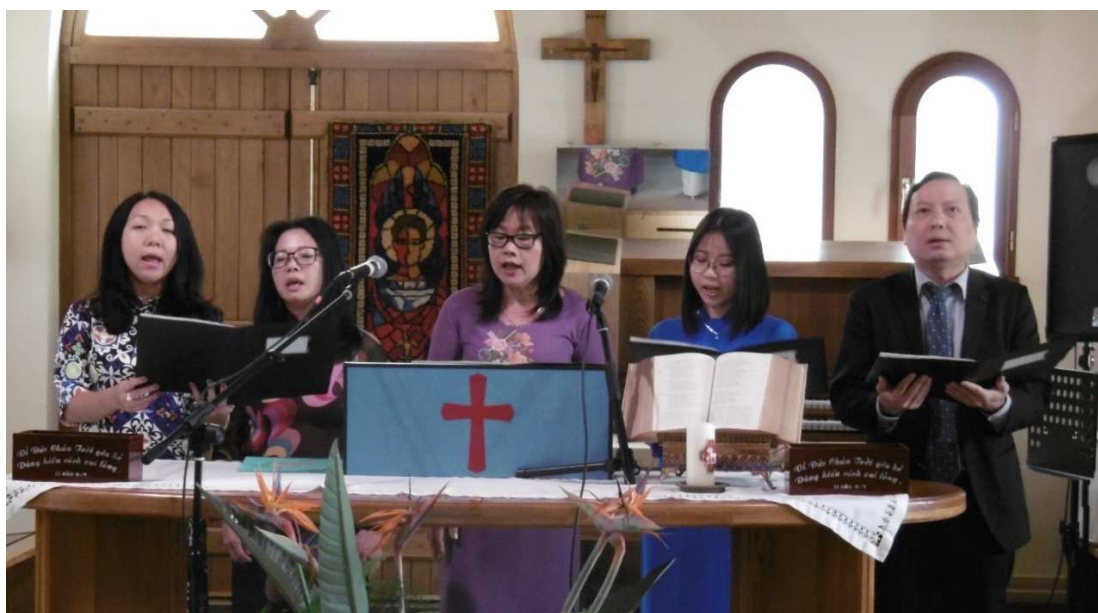
Direction des chants: Chorale de l'Église de Paris