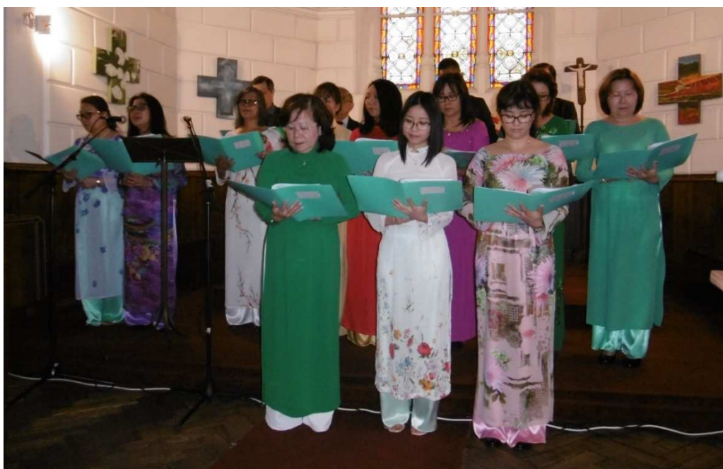
Chant: Gần thập tự (Près de la Croix) - Chorale de Paris