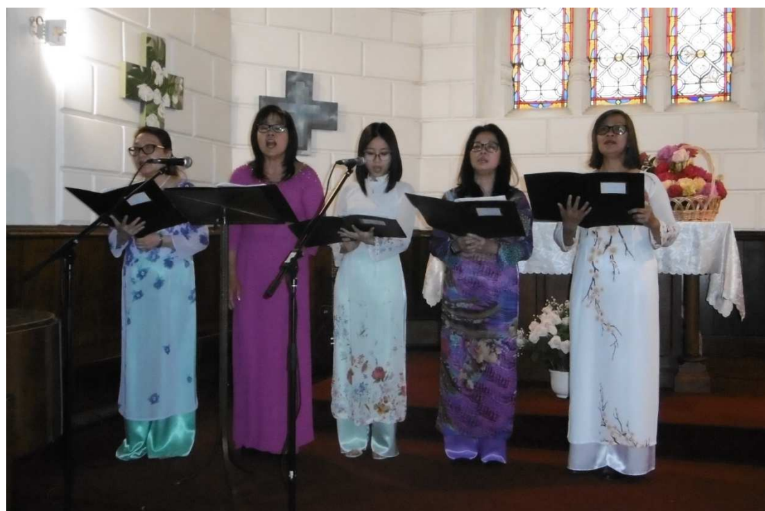
La Chorale de Paris