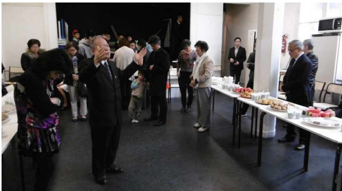
Clôture du Congrès dans la salle de réunion autour d'un repas fraternel