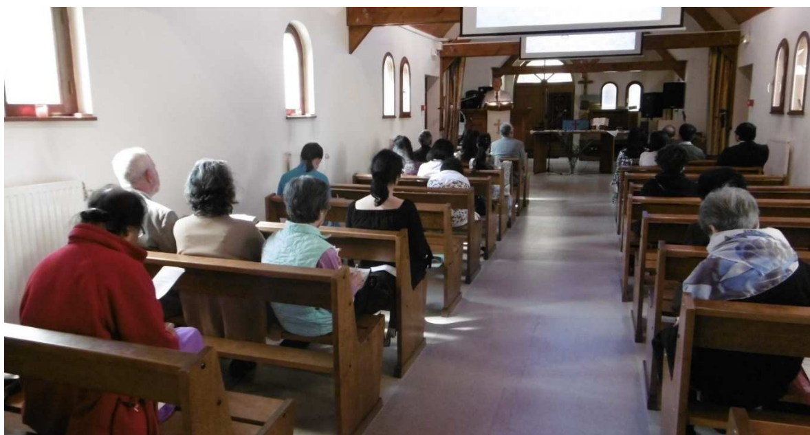
Ecoute de la parole de Dieu