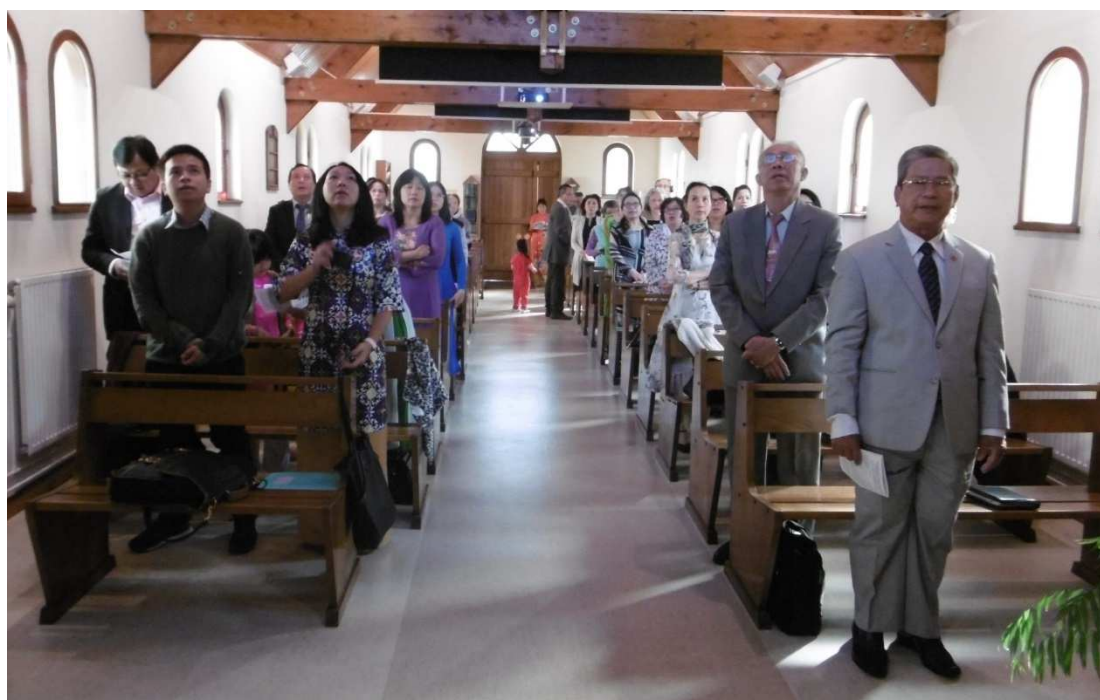
Louanges à Dieu à travers les chants