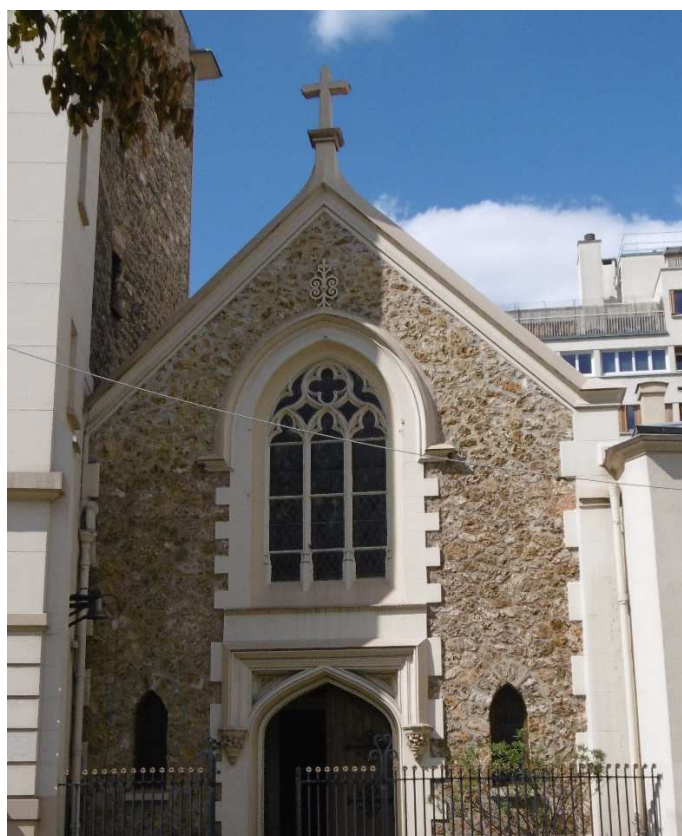
Lieu : Eglise de la Trinité à Paris 13 e