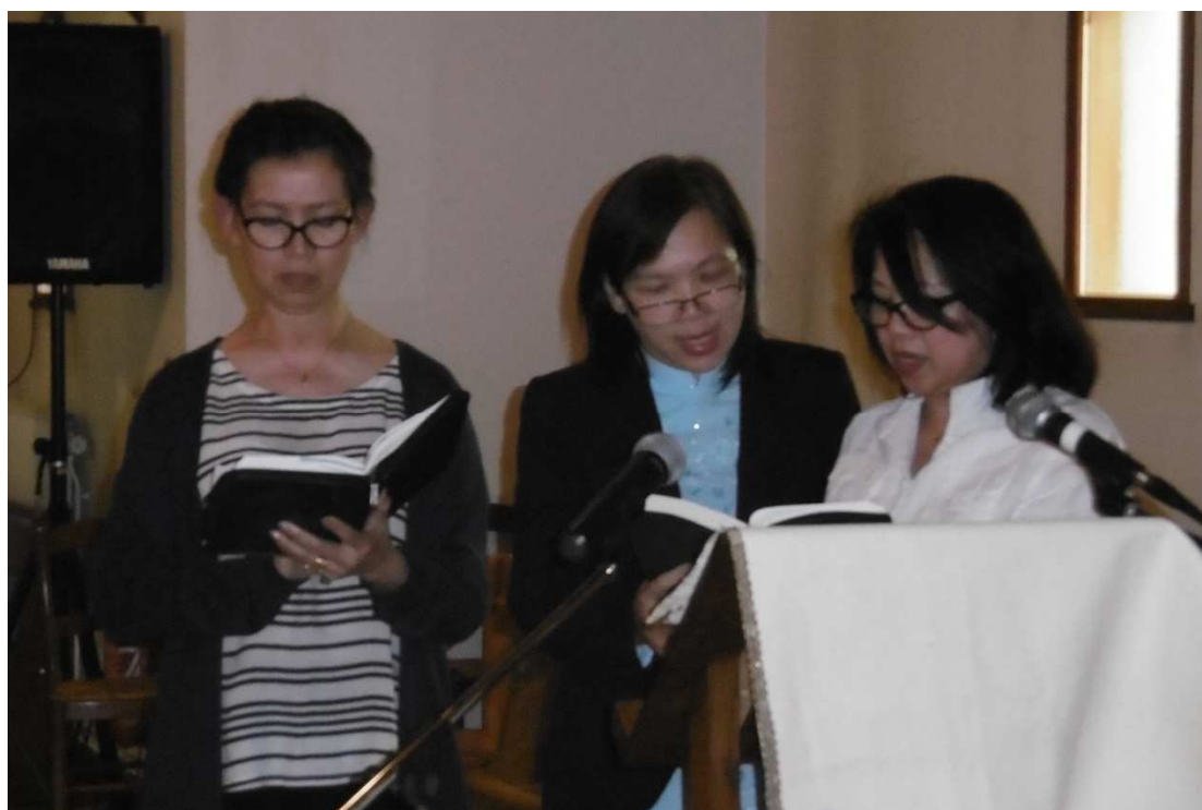
Groupe de Paris & Mulhouse louant Dieu ensemble