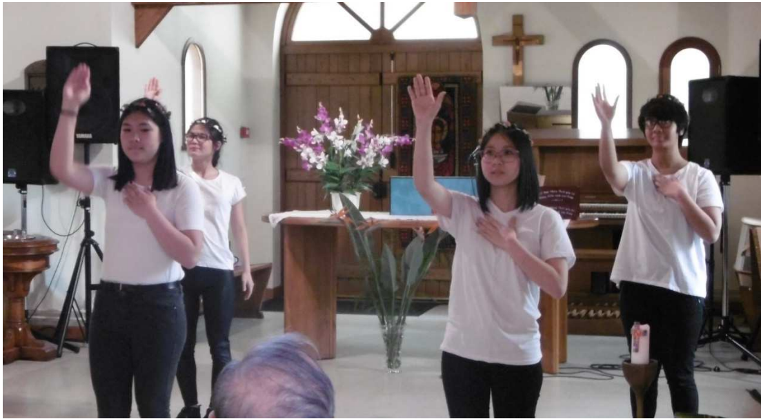
Danse: Không giây phút thiếu Ngài (Pas une seconde sans Dieu) – Les jeunes de Paris