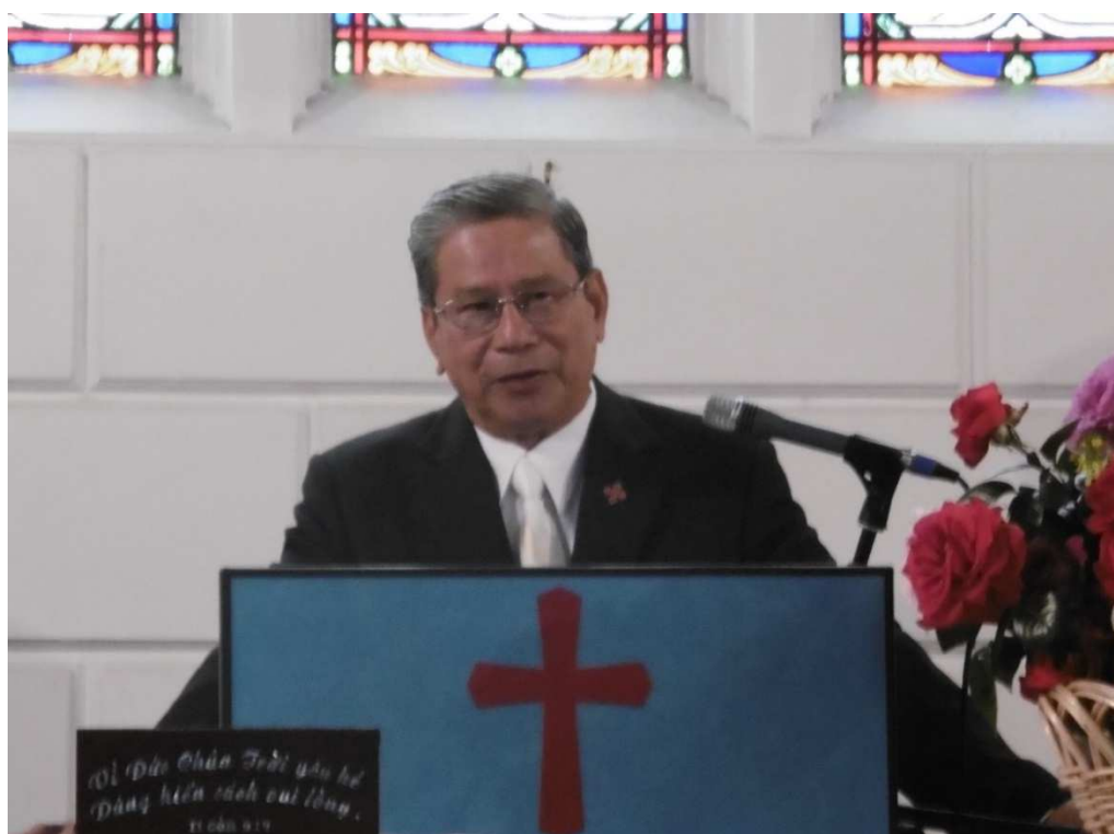
Message: Quyền năng cho sự hiệp một (Pouvoir pour l'unité)