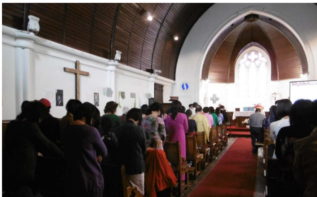
Prière d'ouverture du Culte