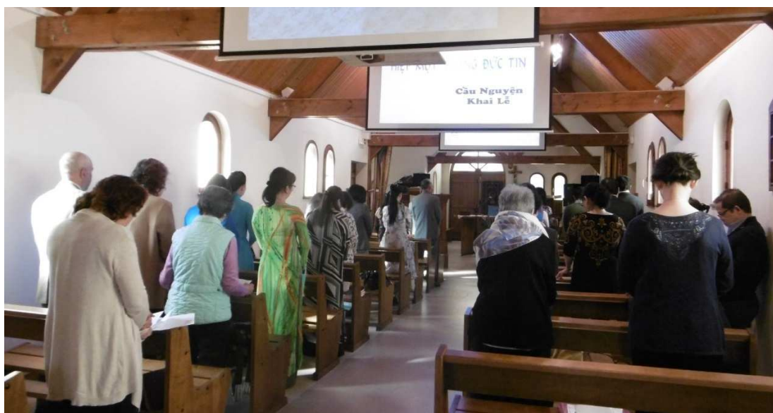
Prière d'ouverture du Congrès