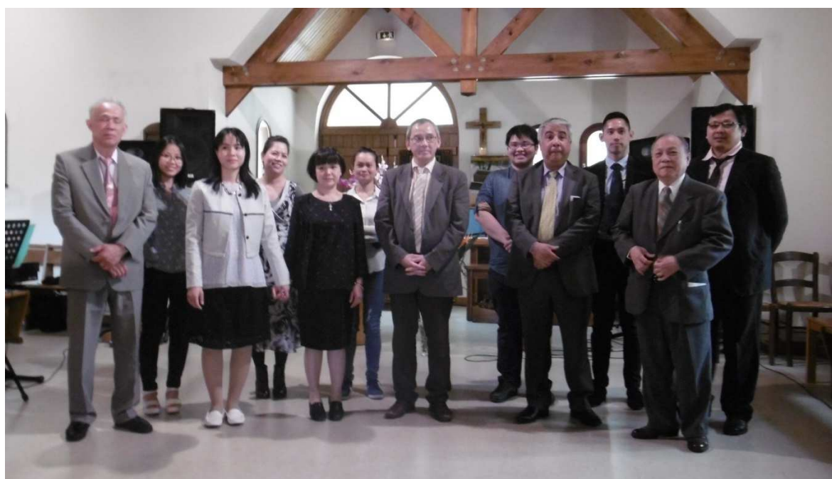
Présentation des deux nouveaux comités exécutifs de l'Eglise Evangélique Vietnamienne de France