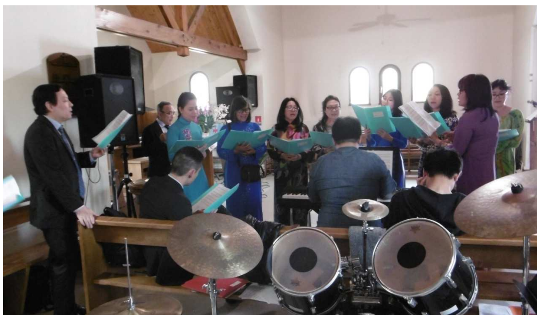
La Chorale de Paris préparant les chants lors de la pause de midi